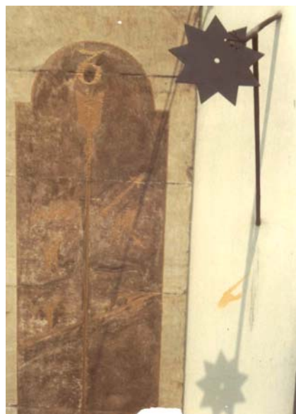
Duomo di Torino: lo gnomone.